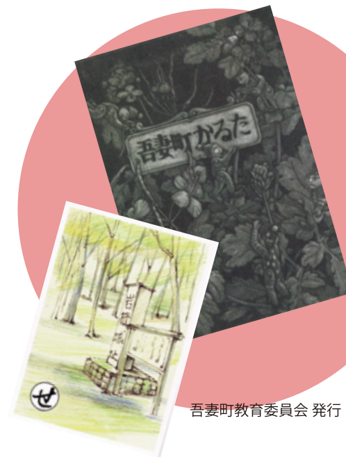
吾妻町教育委員会 発行

旧吾妻町の町村合併40周年記念事業の一環として発行された「吾妻町かるた」でも、岩櫃城の歴史が詠まれています。